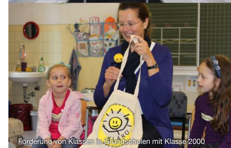
Förderung von Klassen in Grundschulen mit Klasse 2000