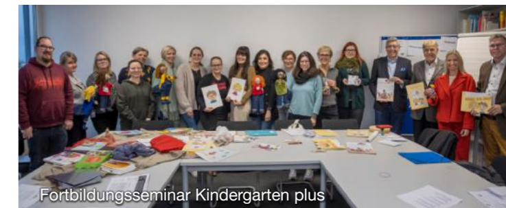
Fortbildungsseminar Kindergarten plus

Mit Ihrem Startgeld und einer zusätzlichen Spende helfen Sie dem Lions Club Bad Wildbad wichtige Hilfe in der Region Nordschwarzwald zu leisten wie z. B. mit unseren Förderprogrammen für Erzieher und Lehrkräfte an Kitas, Haupt- und Realschulen sowie Gymnasien und Klassen an Grundschulen.