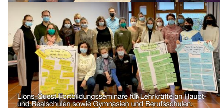
Lions-Quest Fortbildungsseminare für Lehrkräfte an Haupt- und Realschulen sowie Gymnasien und Berufsschulen.