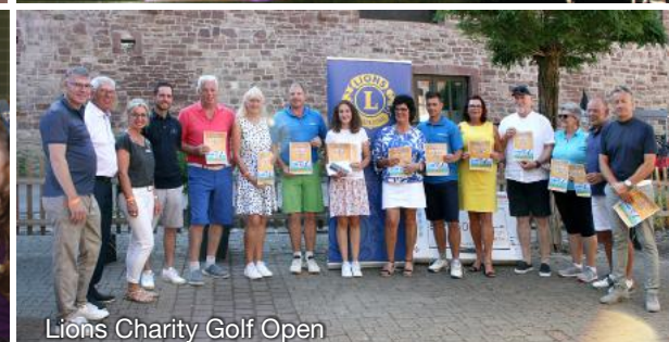
Lions Charity Golf Open