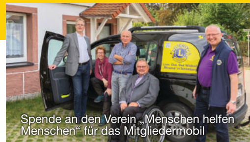
Spende an den Verein „Menschen helfen Menschen“ für das Mitgliedermobil