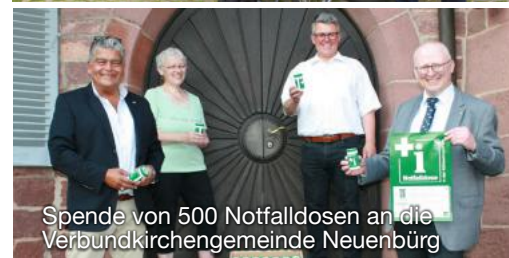
Spende von 500 Notfalldosen an die Verbundkirchengemeinde Neuenbürg