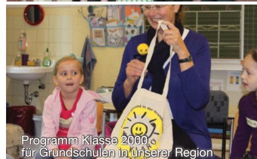
Programm Klasse 2000 für Grundschulen in unserer Region